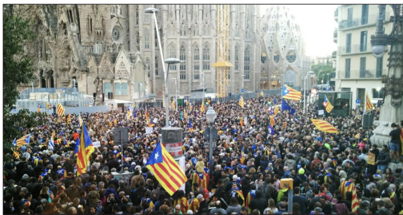
Barcelone le 11 novembre.

EMMANUELLE MÉNARD, députée de l'Hérault, Twitter, 8 novembre 2017.