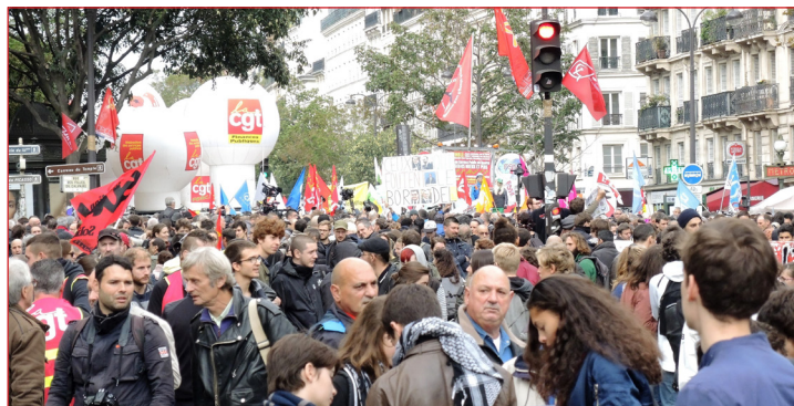
Lors de la manifestation de la fonction publique le 10 octobre.

Face à ces contre-réformes, la mobilisation a débuté par une grève et une participation massive aux manifestations le 10 octobre. Suite à cette journée, la CGT, la CFDT, FO, l'UNSA, la FSU, Solidaires, la CFTC, la CGC et la FA FP ont « acté la poursuite de la mobilisation unitaire » et décidé de boycotter la réunion du Conseil commun de la fonction publique du 6 novembre que devait présider le ministre des Comptes publics, Darmanin, en charge des fonctionnaires. Après la journée de grève, les organisations syndicales avaient appelé à un rassemblement militant devant Bercy mais, sans surprise, cette journée passée totalement inaperçue chez les agentEs n'aura eu aucune influence sur les décisions du gouvernement. Darmanin est resté droit dans ses bottes sur l'ensemble des questions, le 8 novembre dernier, lors du Conseil supérieur de la fonction publique. Face à cette attitude, les organisations syndicales ont décidé de se revoir le 28 novembre prochain pour décider d'une nouvelle journée de mobilisation.