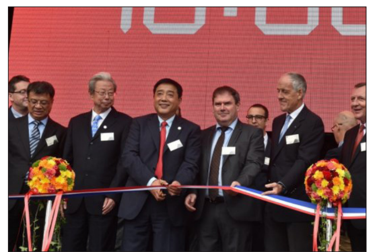
Lors de l'inauguration en grande pompe de l'usine Synutra à Carhaix, le 28 septembre 2016.

Suite à ces révélations l'inspection du travail est intervenue sur le site le 18 octobre, et à la même période la direction de l'usine a réuni les salariés pour